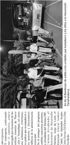
Se dio el Banderazo de salida a las unidades que trasladarán a los niños a la Vacunación Transfronteriza.

Para proteger a las menores de 5 a 12 años y fortalecer así la inmunización contra el COVID-19, el Municipio de Apodaca inicia el programa de vacunación transfronteriza para niños con comorbilidades. Este programa busca inmunizar a 6000 menores que no están incluidos en el esquema nacional de vacunación. El programa es coordinado por el Ayuntamiento de Apodaca y el Hospital General de Apodaca. Los niños serán vacunados en el Hospital General de Apodaca y en centros de salud de la zona. El programa también incluye la entrega de medicamentos y la atención médica de emergencia.