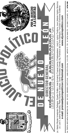
2A. ÉPOCA. SEGUNDA QUINCENA DE ABRIL DE 2022. PRENSA EJECUTIVA. JUANA ESCOBAR No. 1121 COL. MOXTELLO TEL. 81 876 0196 CEL. 813 800 7718 INT. 411. NÚM 96

Con 52 cámaras instaladas que van a estar Juárez que ya son casi 400 en las principales avenidas trabajando en este tema de colonias y 500 mil y torres de vigilancia en la seguridad pública", dijo el alcalde. "Este sistema nos permitirá tener un control total de lo que sucede en el municipio y poder actuar de manera oportuna y eficiente". El nuevo centro de Comando, Control, Comunicaciones y Cómputo (C4) cuenta con un sistema de tecnología e inteligencia artificial que permitirá a los funcionarios municipales monitorear y analizar en tiempo real la información que se genera en el municipio. Este sistema también incluye un sistema de alerta temprana que permitirá a los funcionarios municipales actuar de manera oportuna y eficiente en caso de emergencias.