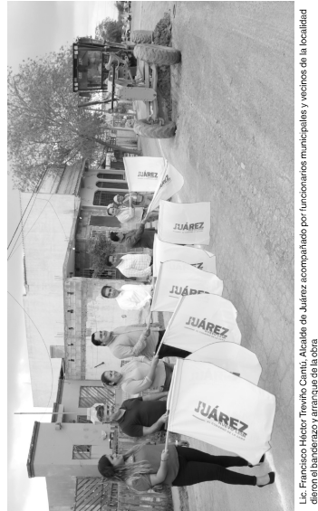
Lic. Francisco Héctor Treviño Cantú, Alcalde de Juárez acompañada por funcionarios municipales y vecinos de la localidad dieron el banderazo y amarró que de la obra.

Primeramente acudió a la colonia Vistas del Río, donde dio inicio a los trabajos de rehabilitación del pavimento en calles de este sector y en una zona de 3 mil 600 metros cuadrados de terreno que se encuentra en el sector de Vistas del Río. Posteriormente, se trasladó a la colonia Jardines de la Silla, donde supervisó los trabajos de pavimentación en un área de 2 mil 200 metros cuadrados. En la colonia Santa Mónica, supervisó los trabajos de bacheo en un área de 1 mil 500 metros cuadrados. Finalmente, se trasladó a la colonia Arcadía, donde supervisó los trabajos de bacheo en un área de 1 mil 500 metros cuadrados. En un momento de la visita, el alcalde dijo: "Queremos agradecer a todos los trabajadores que están realizando estas obras, ya que son fundamentales para mejorar la infraestructura vial de nuestro municipio. Estas obras nos permitirán mejorar la movilidad de nuestros ciudadanos y contribuir a la economía local".