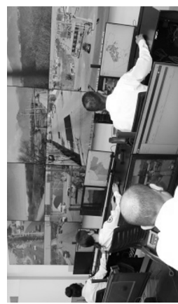
Elementos de seguridad pública bien capacitados salvaguardarán la integridad y seguridad de todos los ciudadanos del Municipio, esto a través de cámaras de vigilancia.